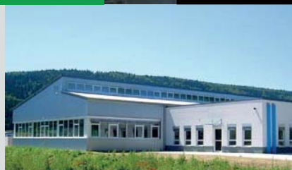
Dausch Medizintechnik GmbH, Wurmlingen Fläche: 1151 m 2 Nutzung: Büros, Produktion