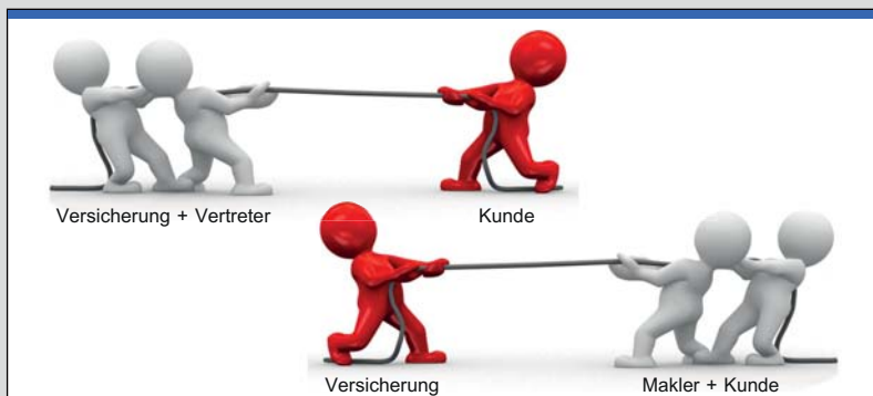
Versicherung + Vertreter

Wertbau GmbH & Co. KG Gehrenstr. 11 D-78576 Liptingen 0049 (0) 7465 / 9292-0 info@Hallen.AG