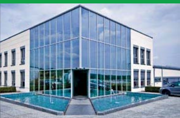
Weber Instrumente GmbH, Emmingen-Liptingen Fläche: 1215 m 2 Nutzung: Büros, Produktion (Medizintechnik)