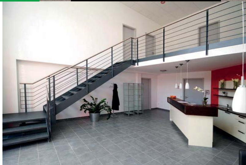
Empfangsbereich der Firma Rudischhauser Surgical Instruments Manufacturing, Tuttlingen